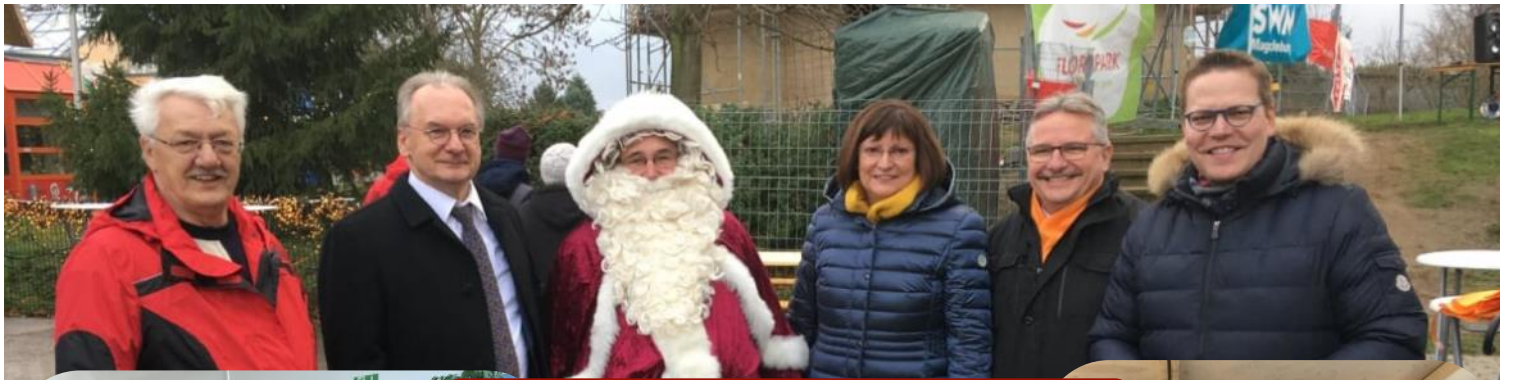
Weihnachtsmarkt Döppler Mühle